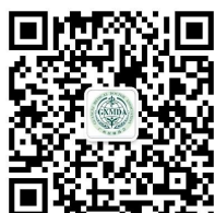
广西医师协会微信公众号