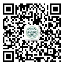
广西医师协会微信公众号