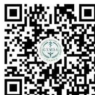
广西医师协会视频号