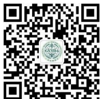
广西医师协会微信公众号